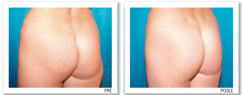
Intervencija podizanja i oblikovanja zadnjice

Šake. Osim na licu, transplatacija vlastite masti može da se iskoristi i za otklanjanje nedostataka na skoro svim delovima tela. Veoma je efikasna kada se primeni na šake, koje često znaju da odaju prave godine kod žena koje su uradile lifting lica i podmladile ga za desetak i više godina, ali im površina šaka odaje stvarne godine. Poledina šake može da se popuni masnim tkivom, tako da one izgledaju glatko. Po jednoj šaci obično se presađuje 10-20ml čiste masnoće.